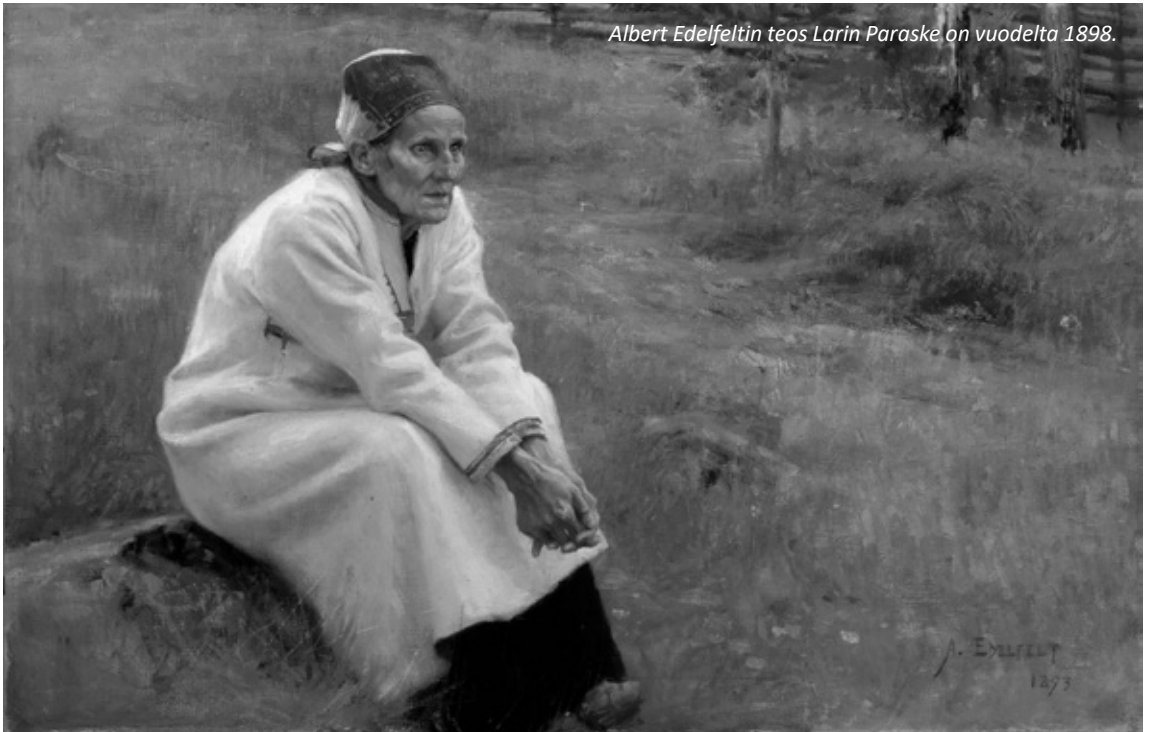
Albert Edelfeltin teos Larin Paraske on vuodelta 1898.

Paimenten osuus laulukulttuurissa oli yleensäkin merkityksellinen: lyhentääkseen päivän yksitoikkoisuutta paimenet, jotka olivat aikoinaan varttunutta