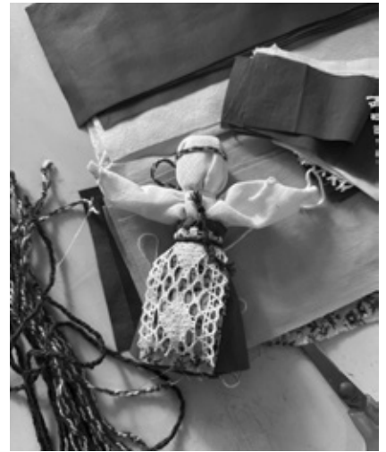
Askartelupajassa syntyi inkeriläisasuisia nukkeja.

Vaikka salissa oli paljon väkeä, siellä ehduttiin vähän tanssimaankin.