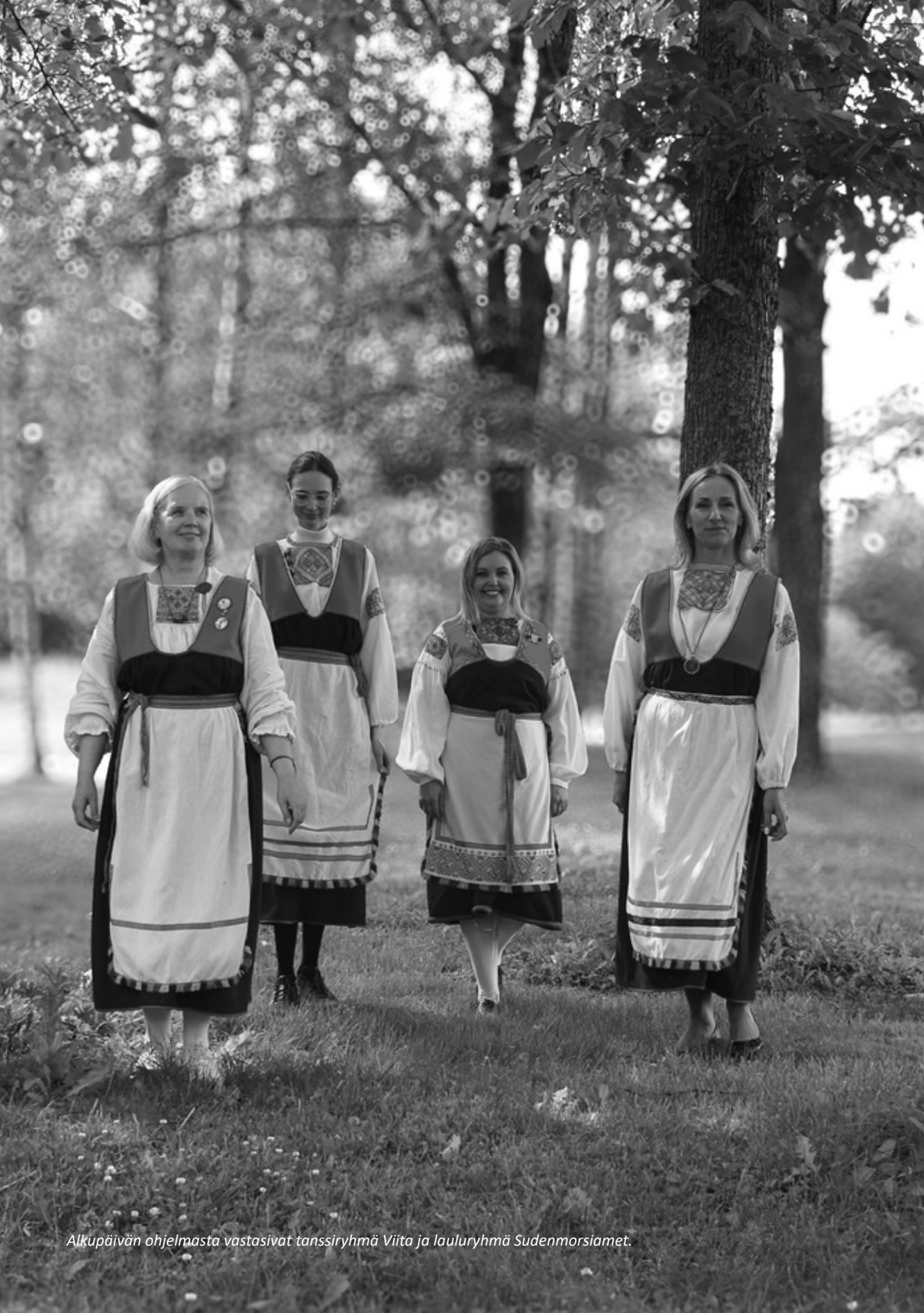
Alkupäivän ohjelmasta vastasivat tanssiryhmä Viita ja lauluryhmä Sudenmorsiamet.