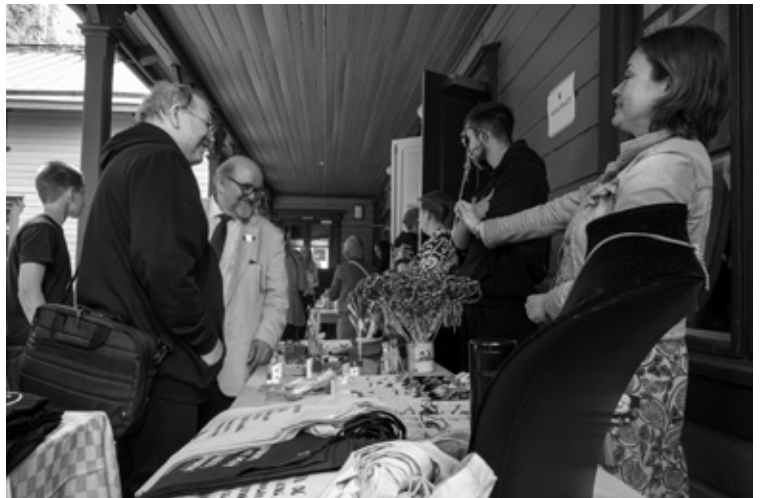
Talon verannalla oli monenlaista myyjää ja kahvipistettä.

– Ja rakennuksena tämä historiallinen tila puistoineen sopii kuin nenä päähän juhliemme päätteeseen. Ohjelman suunnittelussa halusimme huomioida eri ikäluokkien mieltymykset niin, että juhla olisi mielekäs ja kiinnostava sekä vanhemmille että nuoremmille sukupolville. Siksi panostimme markkinoin-