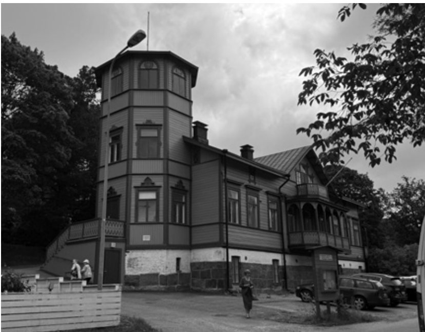
Juhlat järjestettiin tänä vuonna Helsingissä, Oulunkylän vanhalla Seurahuoneella.