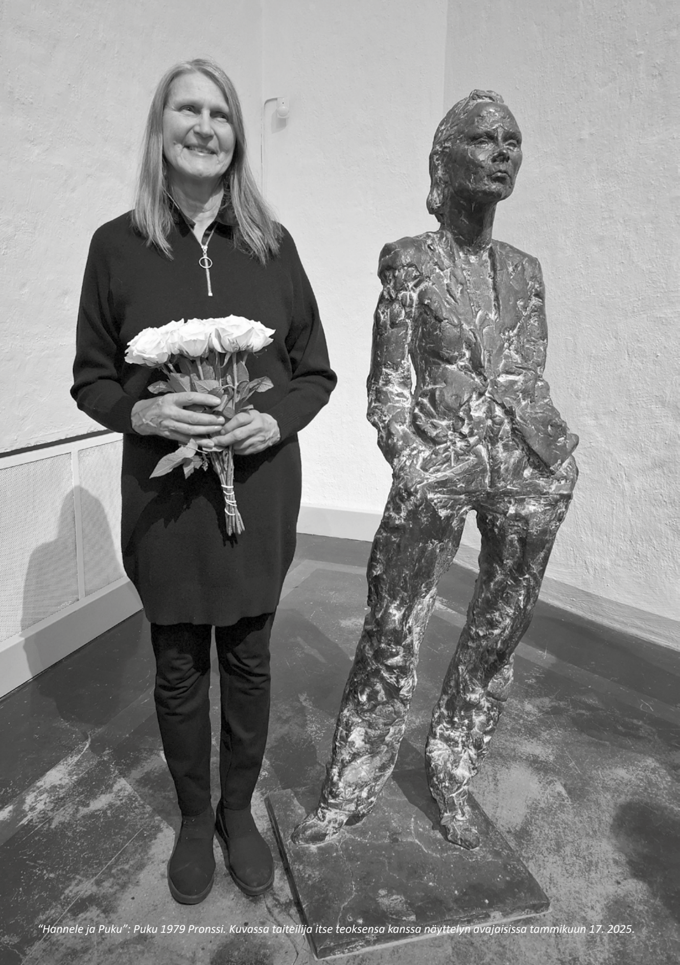
"Hännele ja Puku": Puku 1979 Pronssi. Kuvassa taiteilija itse teoksensa kanssa näyttelyn avajaisissa tammikuun 17. 2025.