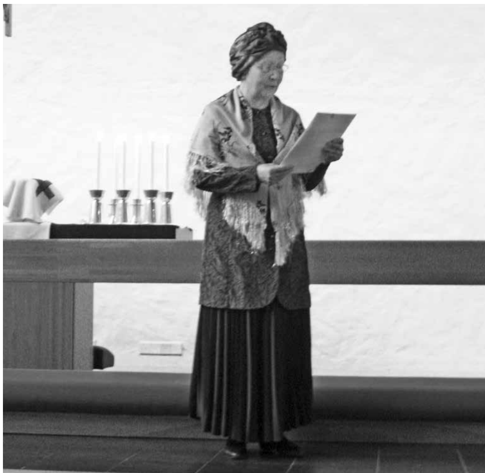
Lilja juontaa kertomusta laupiaasta samarialaisesta Herttoniemen kirkossa.

Ensimmäisenä syksynä koulussa, Uuden vuoden juhlan lähestyessä, opettaja keksi,