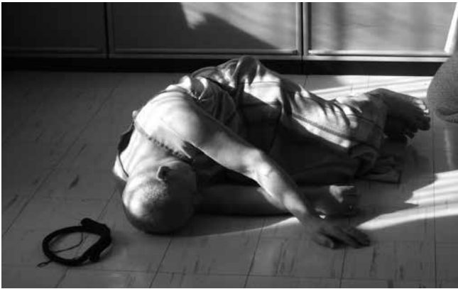
Kuka auttaisi ryöstettyä ja pahoin pidettyä?