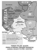
Saksan ja Neuvostoliiton toteuttama Puolan jako 1939

Imperiumien sisällä oli kehittynyt jo 1800-luvun alkupuolelta lähtien voimakas kansallisuusate. Sen kantavana ajatuksena oli, että kieleen ja omaan historiaan nojaavat ihmisyyhteisöt muodostavat kansakunnan ja kansallisvaltiot ovat historian keskeisiä subjekteja. Kansallistunne valtiota muodostavana tekijänä alkoi saada johtavan osan. Siihen saakka muun muassa yhteisellä uskonnolla ja johtavilla sotapäälliköillä kuten kuninkailla oli ollut paljon suurempi vaikutus.