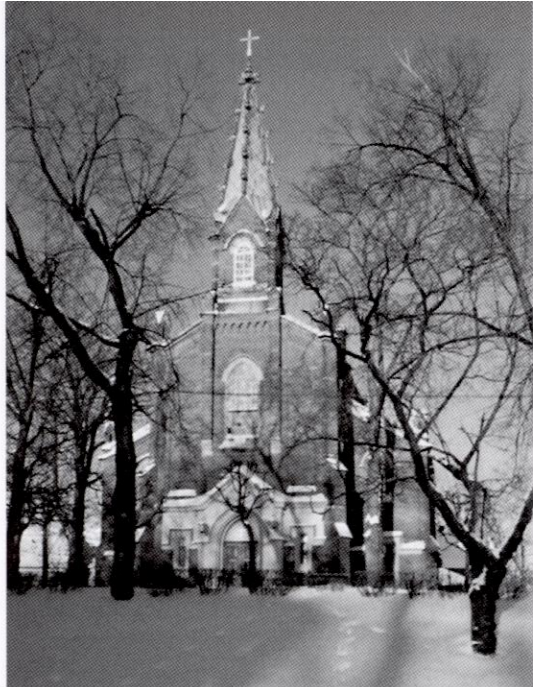
Pushkinin luterilainen kirkko, arkistokuva.