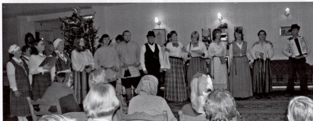
Pietarin kuoro esiintyy Kikkerin palvelutalolla.

Inkerinsuomalaisten Pietarin kuorolla on tapana kierrellä vanhusten palvelutalo-